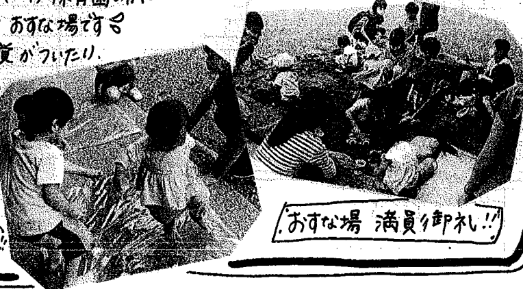
おすな場 満員御礼!!

走ったり、マラソンに挑戦してもらったり、みんながよ～いぞろぞろ!! できるかな。子ども達もおうちの方も一緒に体を動かしてみよう!! 予約なしでお越し頂けます。はじめましての方も登録している方もみんな来てね～!!